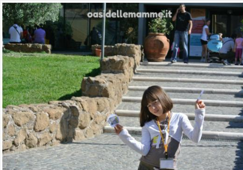
La mia accompagnatrice all'evento di Merendine Italiane

Ci aveva invitate lì, a parlare di prodotti lievitati industriali, l' AIDEPI : l'associazione di categoria che rappresenta la quasi totalità del mercato di questi prodotti, tramite l'Agenzia The Talking Village che per l'Aidepi aveva curato una survey , un'indagine cioè sui gusti, le preferenze e le informazioni conosciute dai consumatori, su questo genere di alimenti.